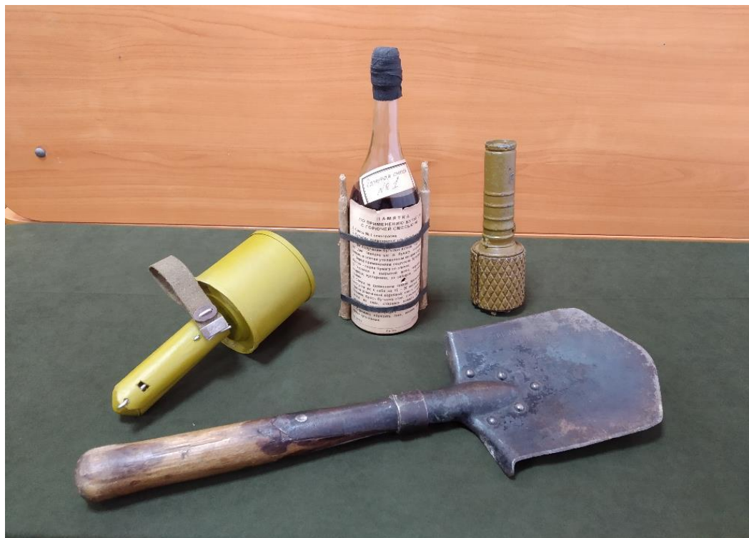
Раздел 4.Предметный стол/планшет с экспонатами, представляющими бытовое снаряжение