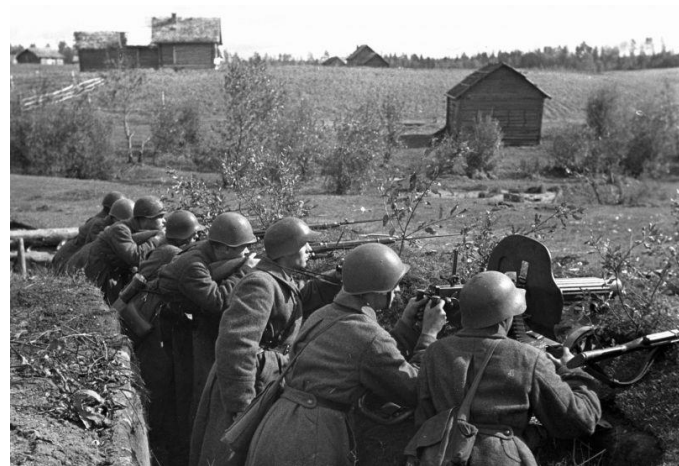
Красноармейцы на позиции у моста на Западном фронте. Октябрь 1941г. 17 .

Вне поля боя бойцы носили пилотки образца 1935 года. Наш экземпляр – пошитая из «правильной» двойной шароварной диагонали по неизменным лекалам пилотка 1969(!) года. А вот пилоточная малая солдатская звездочка на ней подлинная.