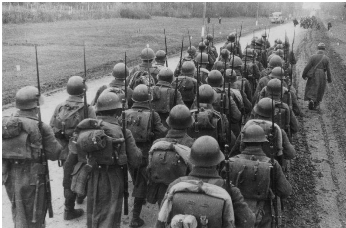
Советский стрелковый взвод на марше к линии фронта. Ноябрь 1941г. 16 .